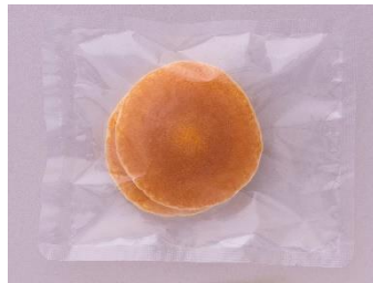
ミニパンケーキ 個包装パッケージ

2018年の発売以来ご好評いただいている「自然解凍ミニパンケーキ」を、この度個包装化して発売します。個包装化することで、高齢者施設の軽食や学校の給食などで、より衛生的で食べやすい形で提供いただけます。