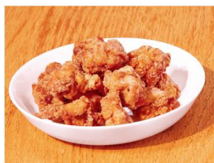
調味のみ（イメージ）