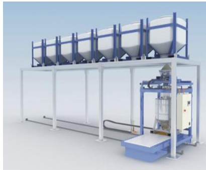
▲マトコン・コンテナシステム