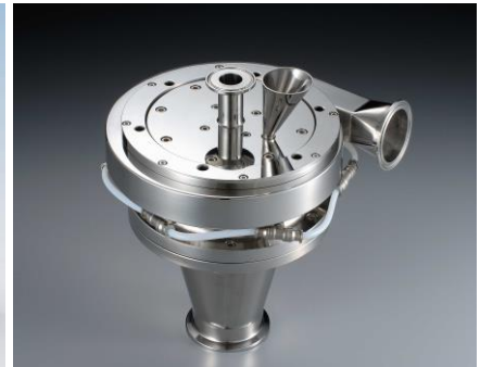
▲エアロファインクラシファイア