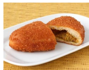
▲もんこさんのカレーシリーズ 使用例

日本のスパイスカレー第一人者として知られる一条もんこ先生が培った技術と、50年以上カレーフィリングを製造する当社の技術で作上げたカレーフィリングです。原料の選定や仕込み方法、スパイスを際立たせる技術により、本格的なカレーに仕上がっています。