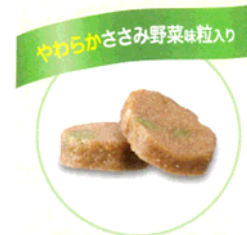
<イメージ図> やわらか粒