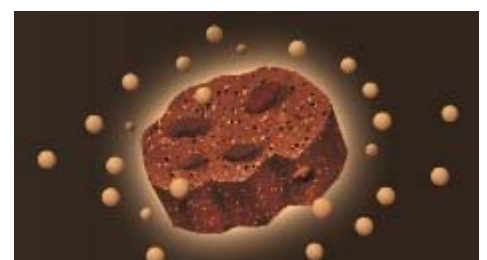
<イメージ図> やわらか練り込み粒