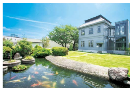
▲製粉ミュージアム外観

この件に関する報道関係者の方のお問い合わせ先 株式会社日清製粉グループ本社 総務本部広報部 担当：佐々井、堀野 東京都千代田区神田錦町1-25 電話：03-5282-6650