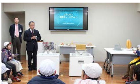
▲製粉ラボ教室の様子