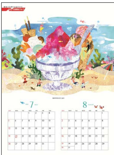
▲7・8月：海の中のかきごおり

当カレンダーは、環境に配慮してベジタブルインキで印刷するほか、ヘッダー部分は留め金具を使用せず紙製にしています。また、暦部分には月ごとにミシン目（切れ目）を入れており、既に経過した月を切り離すと、翌月分の暦が見えるような工夫を施しています（下図参照）。