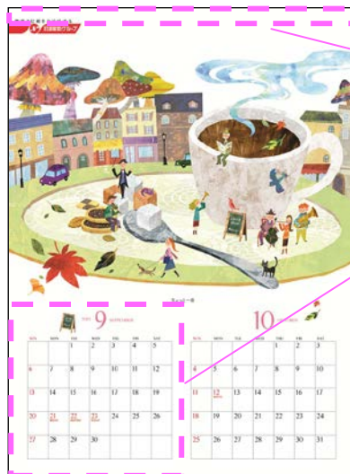
▲9・10月：ちょっと一息