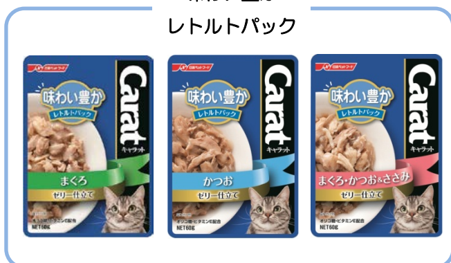
味わい豊か レトルトパック