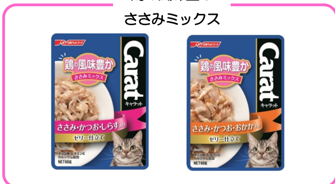
鶏の風味豊か ささみミックス