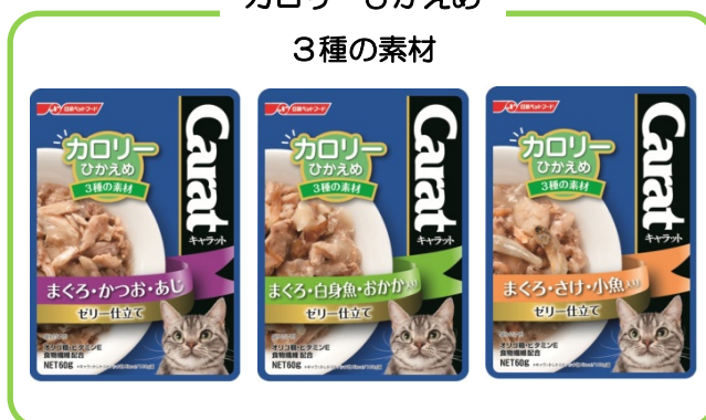
カロリーひかえめ 3種の素材