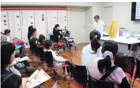
▲ワークショップの様子