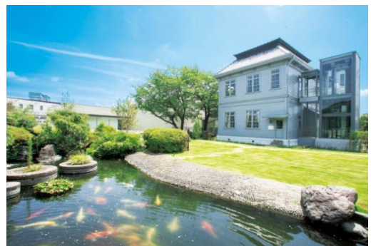
▲製粉ミュージアム外観