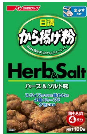
日清 から揚げ粉 ハーブ&ソルト味

バジル・タイム・オレガノ・ローズマリーでアクセントをきかせた、クセになる味わい。