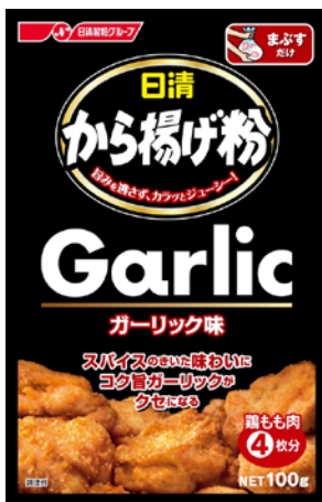
日清 から揚げ粉 ガーリック味

※インターズ SRI から揚げ粉市場 2013年4月～2016年3月販売容量アイテムランキング