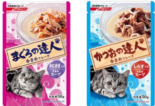
▲新発売のレトルトタイプ！