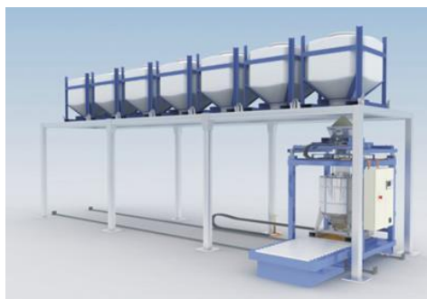
▲マトコン・コンテナシステム