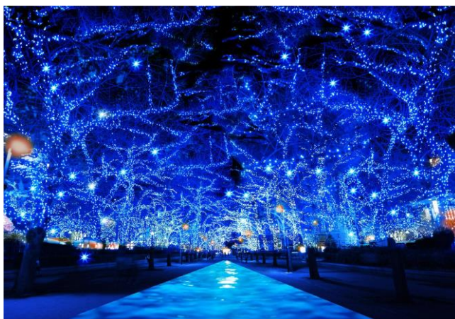
▲『青の洞窟 SHIBUYA』イルミネーションイメージ