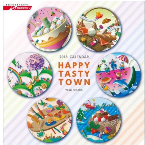
▲カレンダー表紙の作品デザイン

「健康で豊かな生活づくりに貢献する」という当社グループの企業理念を、ケーキやパンなどを題材に、毎日楽しくわくわくさせる“食のワンダーランド（＝HAPPY TASTY TOWN）”として表現しています。