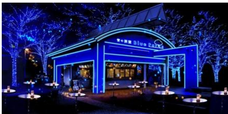
▲「青の洞窟 Blue Parks」店舗イメージ