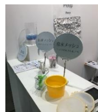
▲実験コーナー（イメージ）