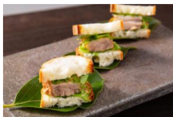
豚の角煮 ソフトフランスサンド 日清製粉「リスドオル」使用