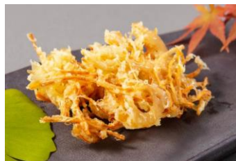
根菜きんぴらのかき揚げ 日清フーズ「コツのいらぬ天ぷら粉」使用