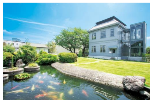
▲製粉ミュージアム外観