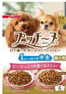
▲「プッチーヌ」シリーズ