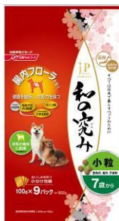
▲「JPスタイル 和の究み」シリーズ

※注カブランド…「JPスタイル 和の究み」シリーズ、「プッチーヌ」シリーズ、「懐石」シリーズ