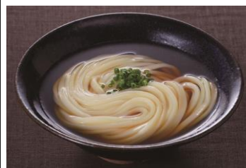
▲製品使用イメージ

「黄色く、冴えた色調」「当社のうどん用粉の最高峰」を象徴し、「金」という文字を使用。「きんうどん」をネーミングに内包させ、「う」と「と」を並び替え、「金斗雲（きんとうん）」というネーミングとしました。