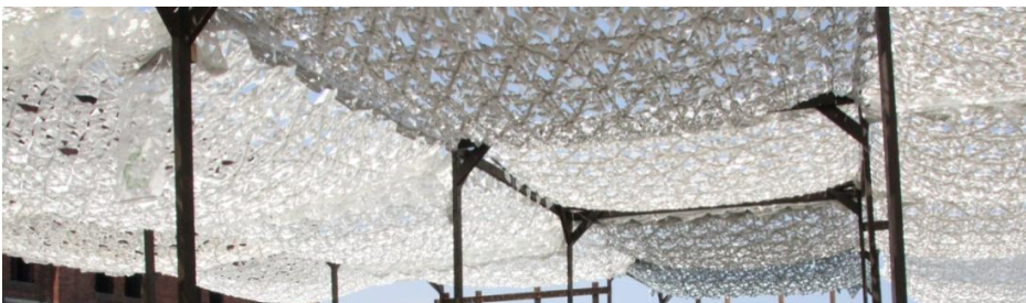
▲「フラクタルひよけ」設置例

「フラクタルひよけ」は、電気などのエネルギーを使用せず、設置するだけで優れた冷却効果を発揮する理想的な環境製品であり、その効果は公的機関や民間での実証実験によっても証明されています。