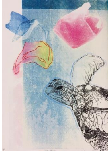
■準大賞 Lujiang Li (CHINA) 「Sea World」