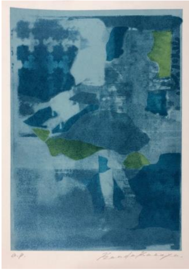
■準大賞 神田 和也 (JAPAN) 「Lost Image Photograph 19 - 03」