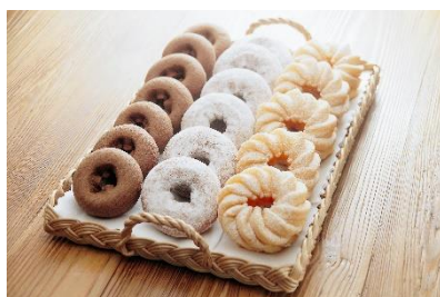
▲ケーキドーナツ用プレミックス 使用例

新製品を含むさまざまなドーナツミックスをご紹介します。もちもち、ふんわり、さっくりなど、バラエティに富んだ食感のドーナツミックスをご用意します。