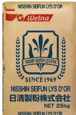
フランスパン用粉