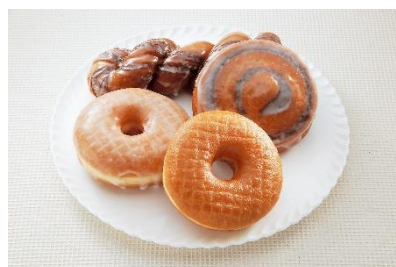
▲イーストドーナツ用プレミックス 使用例