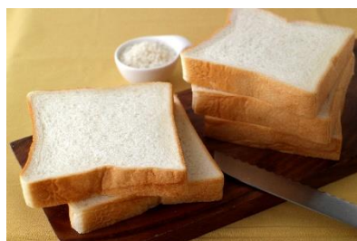
▲パン品質改良剤使用例

パンの品質向上（ボリュームや食感等）や安定的な生産（品質安定、ロスの削減等）に寄与する品質改良剤を、用途別に紹介します。