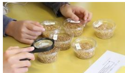
▲当社担当講座イメージ